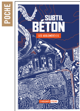
SUBTIL BÉTON LES AGGLOMÉRÉ-E-S