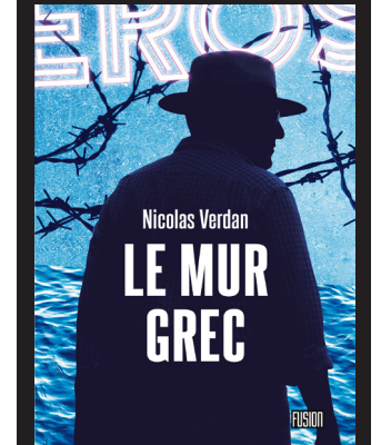
LE MUR GREC NICOLAS VERDAN FUSION