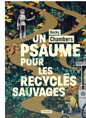
UN PSAUME POUR LES RECYCLÉS SAUVAGES BECKY CHAMBERS Traduit de l'anglais par Marie Surgers