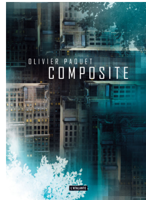
COMPOSITE OLIVIER PAQUET