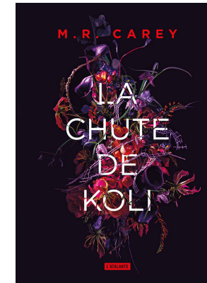
LA CHUTE DE KOLI M.R. CAREY Traduit de l'anglais par Patrick Couton