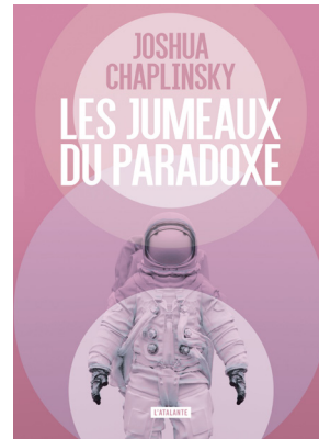
LES JUMEAUX DU PARADOXE JOSHUA CHAPLINSKY Traduit de l'anglais par Mikael Cabon