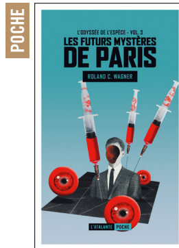
L'ODYSSEE DE L'ESPECE VOL. 3 LES FUTURS MYSTERES DE PARIS ROLAND C. WAGNER