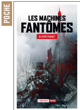
LES MACHINES FANTÔMES OLIVIER PAQUET