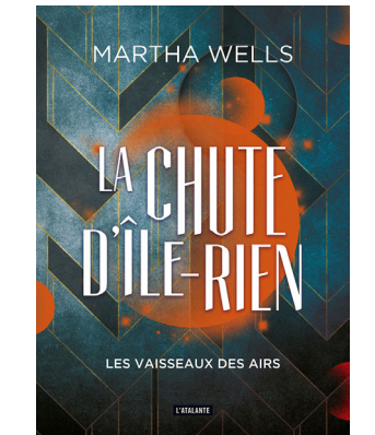
LES VAISSEAUX DES AIRS MARTHA WELLS Traduit de l'anglais par Anne Belle